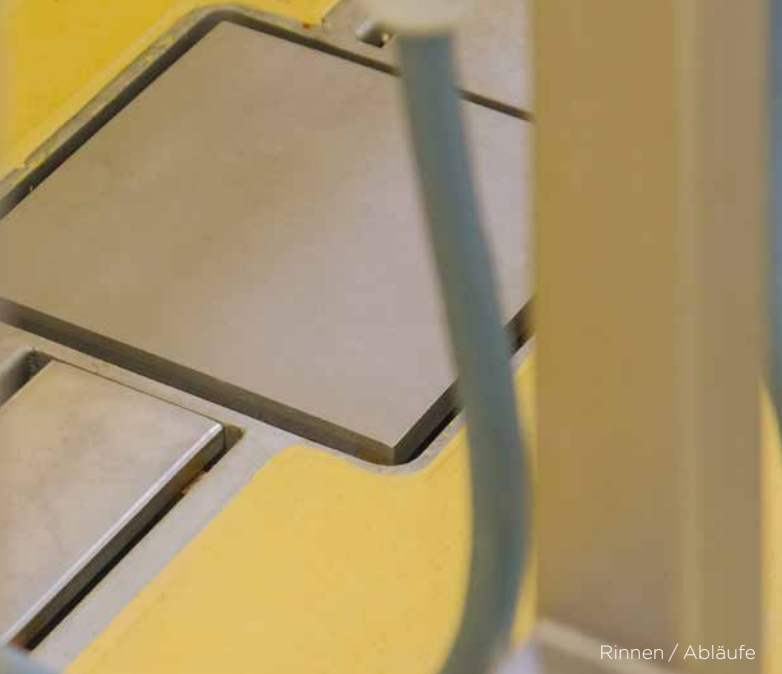
Rinnen / Abläufe