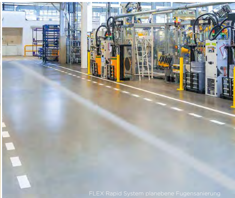
FLEX Rapid System planebene Fugensanierung