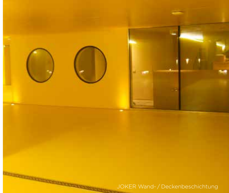
JOKER Wand- / Deckenbeschichtung