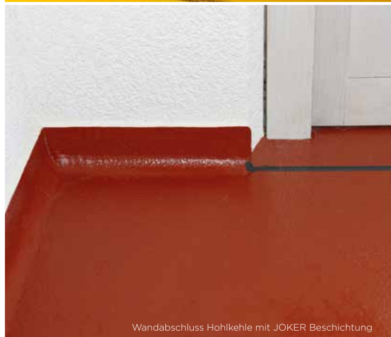
Wandabschluss Hohlkehle mit JOKER Beschichtung