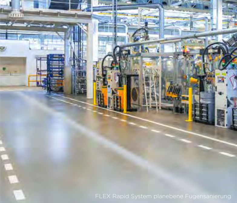
FLEX Rapid System planebene Fugensanierung