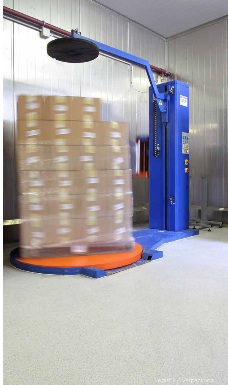
Logistik / Verpackung